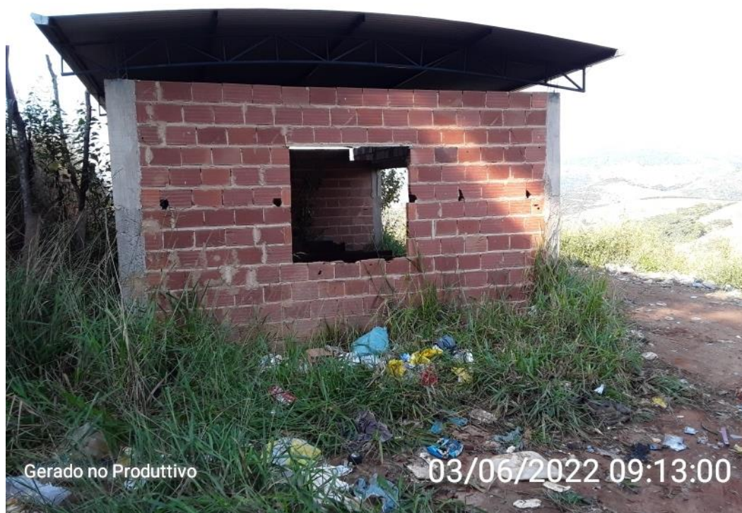
Figura 4 – Área da UTC

O município de Chalé não realiza a triagem dos resíduos coletados, porém possuem na área do Atual Lixão Municipal estruturas já construída onde seria realizado o tratamento dos RSU por meio da triagem e compostagem (Figuras 4,5 e 6). Além disso, a atividade de triagem e compostagem dos resíduos sólidos urbanos já se encontra regularizada conforme a demanda dos órgãos ambientais competentes na modalidade LAS/RAS (Figura 7). Logo se vê a necessidade do município em se adaptar as normas vigentes referentes a destinação final adequada dos rejeitos e ao tratamento dos resíduos com potencial de reciclagem conforme prevê a Lei 12.305/2010.