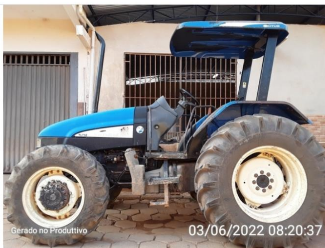
Veículo parte lateral sem identificação.

O veículo permite vazamento ou derramamento do resíduo? (ABNT NBR 13221:2017) Sim