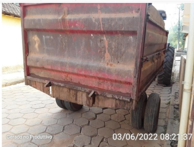
A carreta agrícola do trator não permite o acondicionamento de RSU adequado.

O veículo permite vazamento ou derramamento do resíduo? (ABNT NBR 13221:2017) Sim