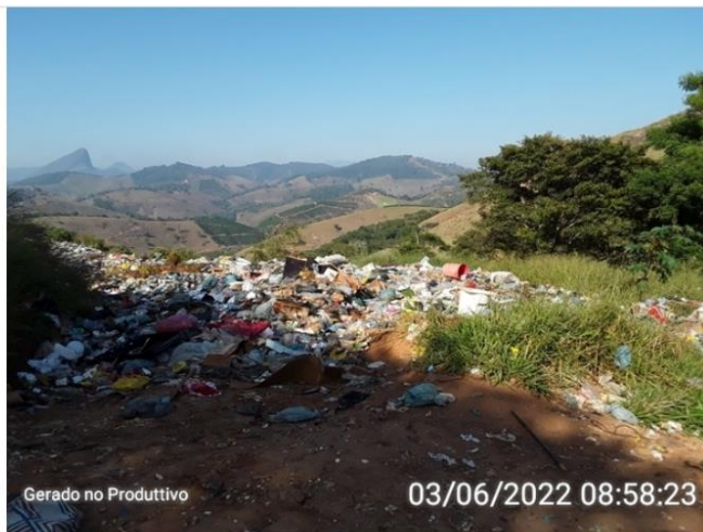
Resíduos dispostos sem cobertura na área do lixão.