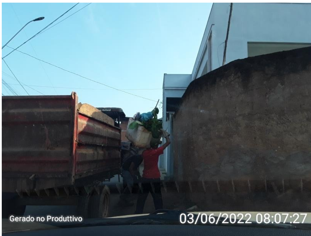
Figura 3 - Acompanhamento das Rotas durante o turno matutino