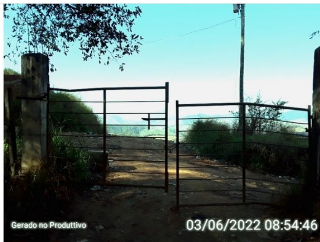
Portão de acesso ao lixão municipal.