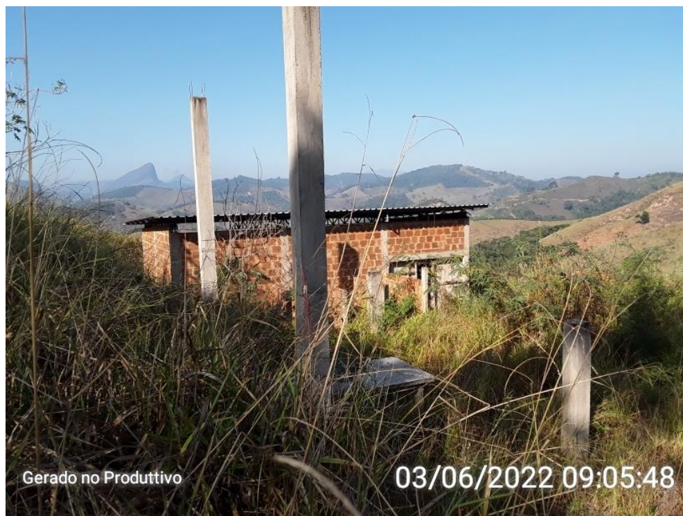
Figura 5 – Vista superior do Local do Galpão da UTC