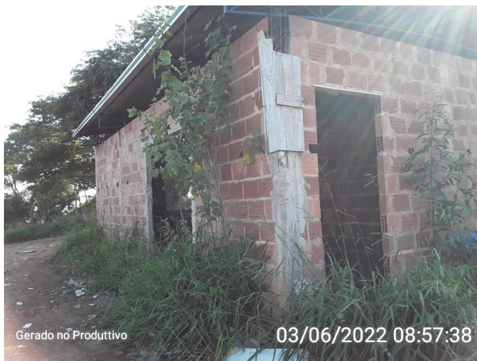
Figura 6 – Estruturas local do UTC