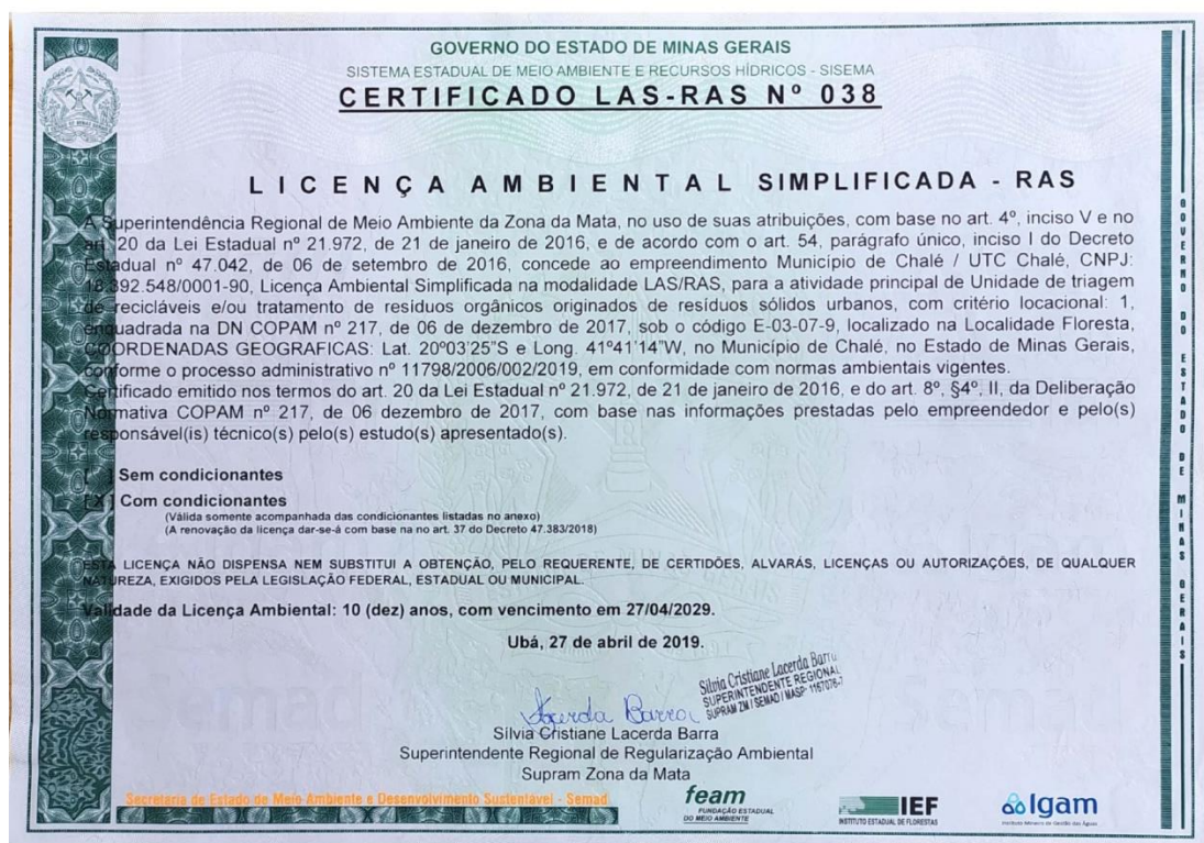
Figura 7 – Estruturas local do UTC