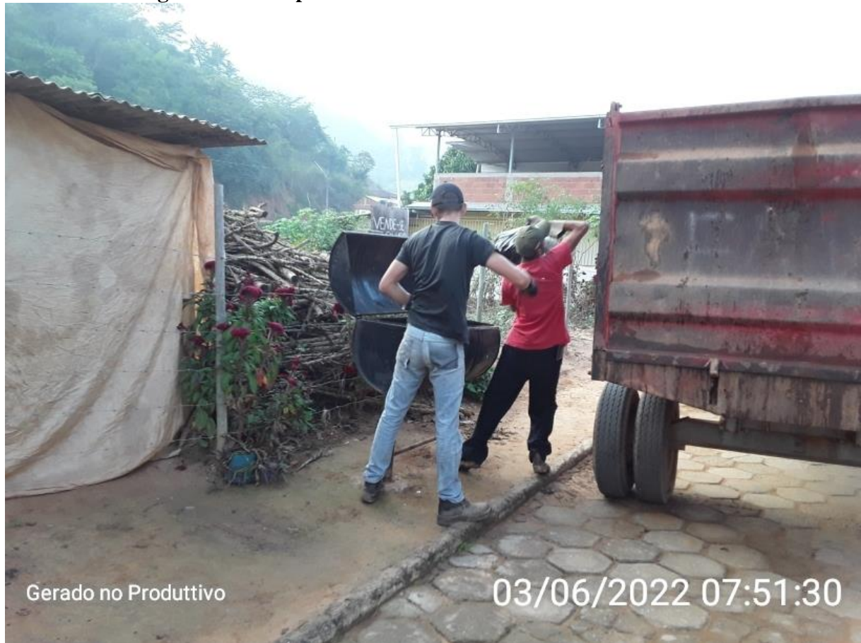
Figura 2 - Acompanhamento das Rotas durante o turno matutino