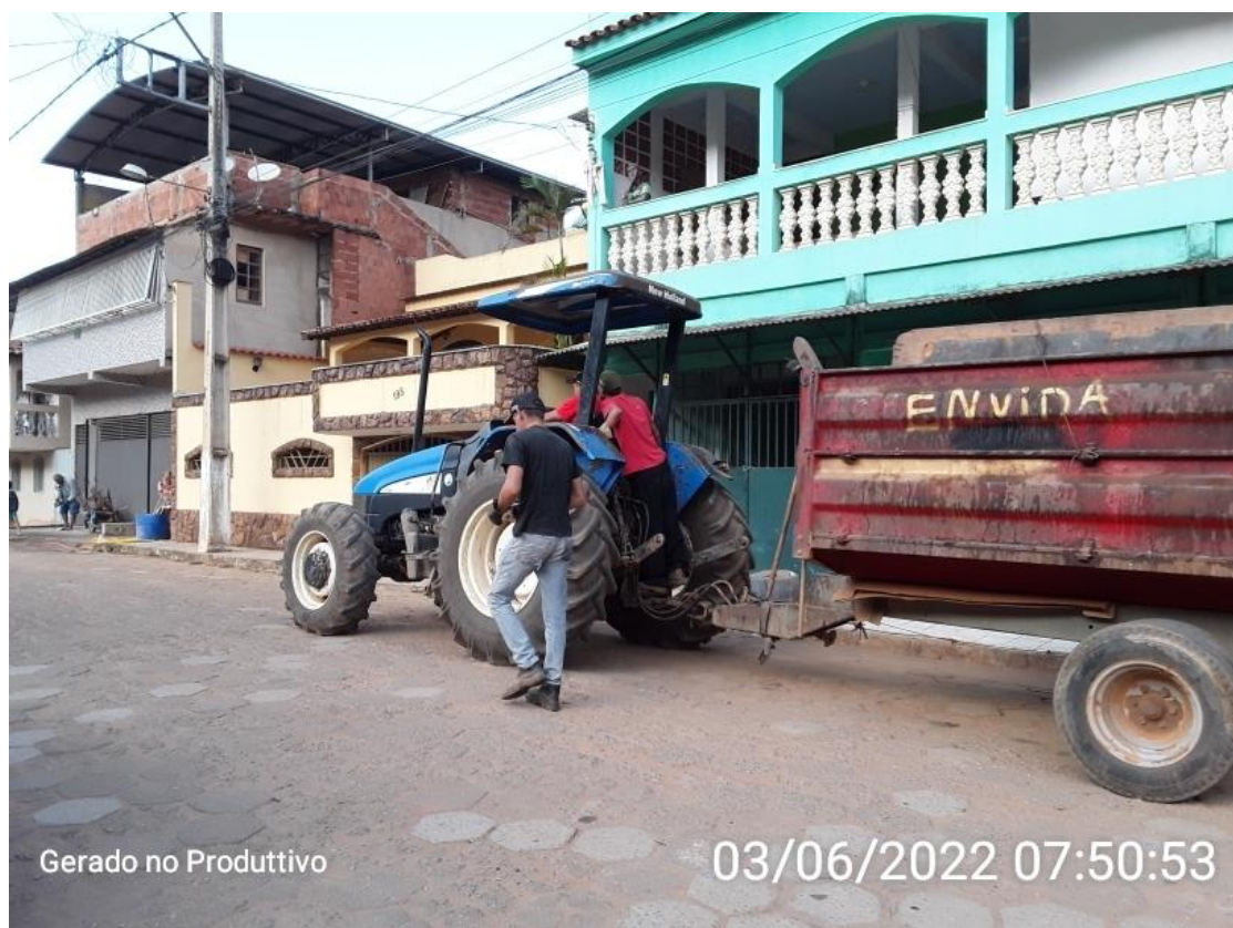
Figura 1 - Acompanhamento das Rotas durante o turno matutino

As Figuras 1, 2, 3 ilustram o percurso feito pelos funcionários da equipe de coleta de resíduos sólidos urbanos na Sede. As demais considerações observadas estão descritas a seguir: